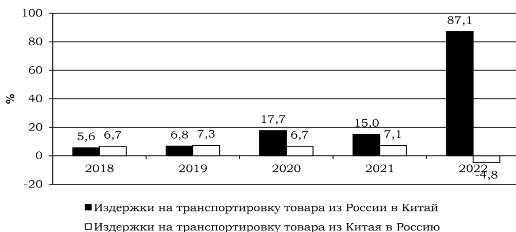
Рис.2. Доля издержек на транспортировку товаров между Россией и КНР

Рассчитано по: UNCTADstat. https://unctadstat.unctad.org/wds/ReportFolders/reportFolders.aspx?sCS_ChosenLang=en ; Customs statistics / General Administration of Customs of the People's Republic of China. http://stats.customs.gov.cn/indexEn