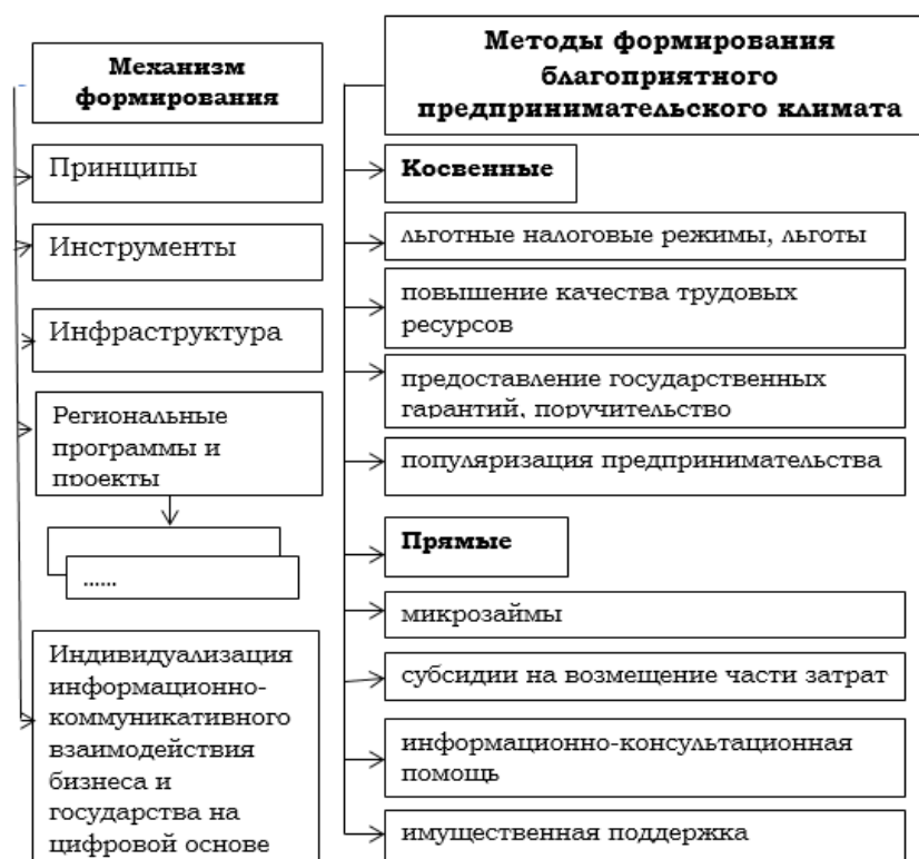
Рис. 2. Концептуальные подходы к формированию условий благоприятного предпринимательского (делового и инвестиционного) климата

дополнительную информацию. Однако, как было отмечено ранее, предпринимателям очень сложно ориентироваться в этом огромном объеме информационных ресурсов. В этой связи требуется разработка некой дорожной карты для предпринимателя по предоставлению ему возможности в получении государственной имущественной поддержки и его скрупулёзном сопровождении «под ключ»: от момента обращения до получения желаемого имущества.