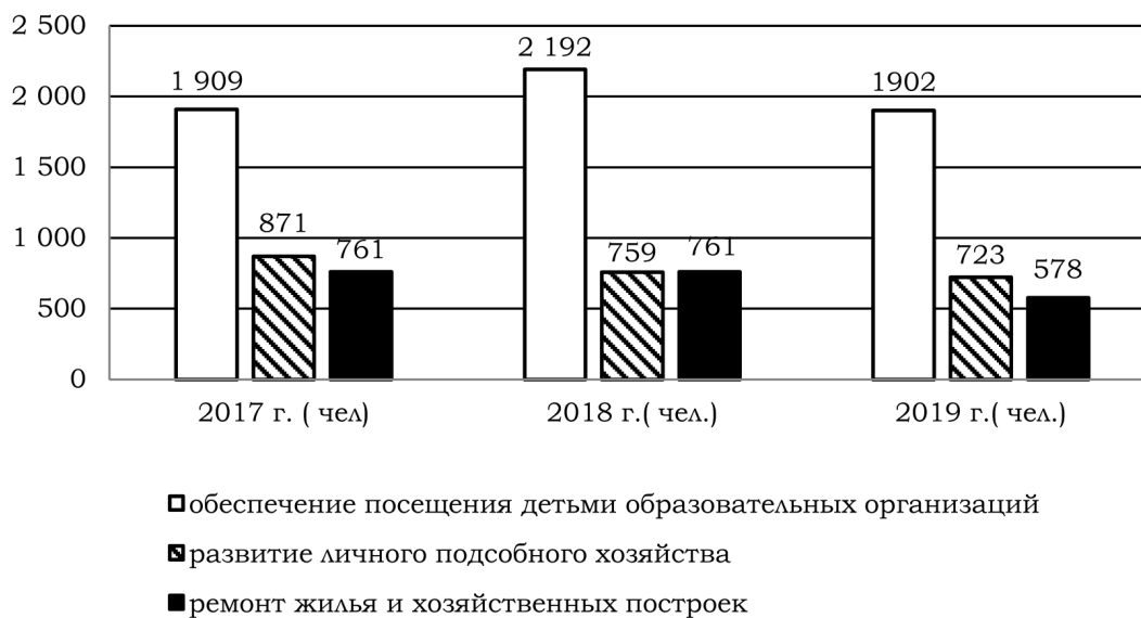
Рис. 1. Численность семей, заключивших социальные контракты по отдельным направлениям оказываемой помощи в Хабаровском крае

населения о предоставляемой социальной помощи данного вида.