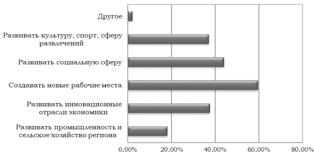
Рис. 4. Условия, при которых молодежь перестанет покидать регион, в %