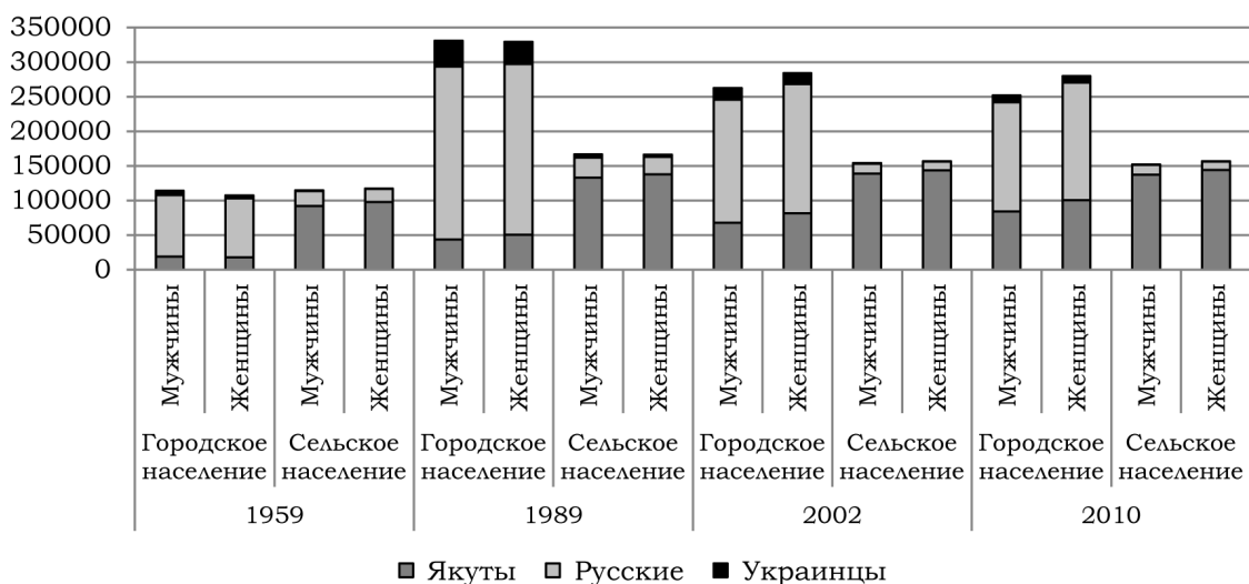
Рис. 1. Динамика численности трех этносов в Якутии мужчин и женщин по итогам четырех переписей населения, чел.

С 1991 г. в связи с социально-экономическими реформами в обществе, внесшими колоссальные изменения и диспропорции на рынке труда республики, отмечается интенсивный рост миграционной убыли населения до 1994 г., когда был достигнут максимум убыли – -31,266 тыс. чел. при численности населения 1064,6 тыс. чел. В этот период в этнической структуре республики произошли изменения: значительно сократилась доля русского населения, выросла доля якутов, увеличилась численность коренных малочисленных народов Севера. Несмотря на постепенное сокращение массовой убыли населения республики, миграционный прирост в регионе остается отрицательным, хотя роль входящей миграции в формировании структуры населения остается чрезвычайно актуальной: она является одним из главных факторов изменения численности населения республики. По данным Росстата 3 , в 2019 г. доля межрегиональ-