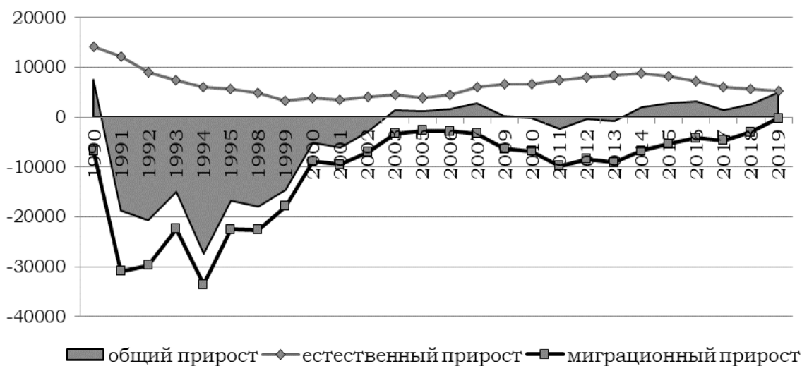
Рис. 3. Соотношение естественного, миграционного и общего прироста численности населения РС(Я) по годам, чел. е

Миграционные процессы в местах основных потоков миграционного обмена в Республике Саха (Якутия) (в г. Якутске и центрах крупных отраслей добывающей промышленности республики) неоднозначны. Районы республики очень сильно отличаются по социально-экономическому, демографическому и национальному составу, этно-культурному