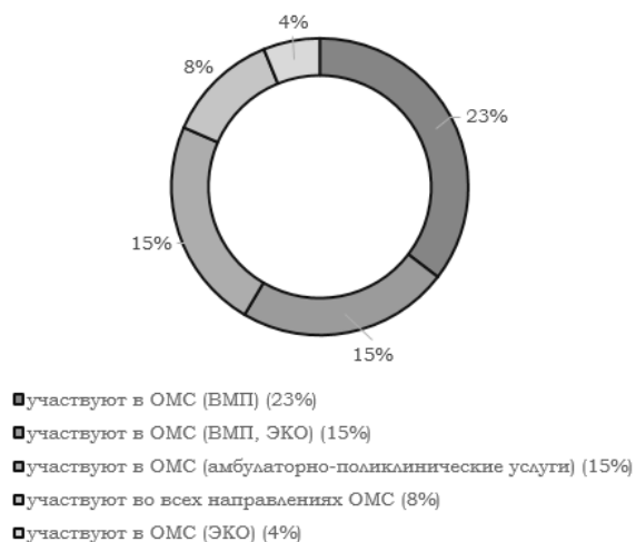
Рис. 2. Участие клиник в системе обязательного медицинского страхования по видам оказываемых услуг, в %

можно сделать вывод, что рынок платных медицинских услуг в настоящее время еще недостаточно развит в России. Между тем с каждым годом растет доля участия коммерческих медицинских организаций в процессе оказания разного рода медицинских услуг населению. Эффективное сочетание рыночных механизмов и государственного участия будет оказывать положительный эффект на