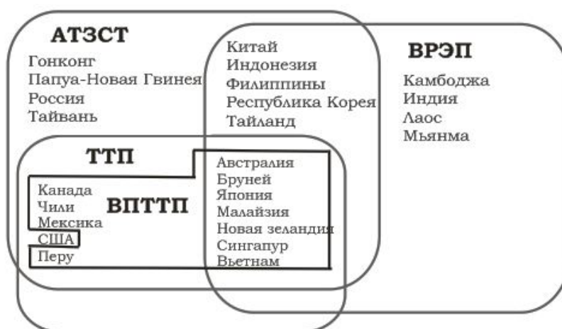
Рис. 1. Соглашения о создании ЗСТ в АТР

В 2004 г. Бруней, Новая Зеландия, Сингапур и Чили заключили между собой соглашение о создании Транстихоокеанского партнёрства. В 2008 г. к переговорам присоединились США, которые привлекли к обсуждению соглашения своих главных торговых партнёров – Мексику и Канаду. С 2010 г. начались активные переговоры о заключении полноценного интеграционного соглашения в составе двенадцати стран. Соглашение о ТТП было подписано в феврале 2016 г. и передано на ратификацию в парламен-